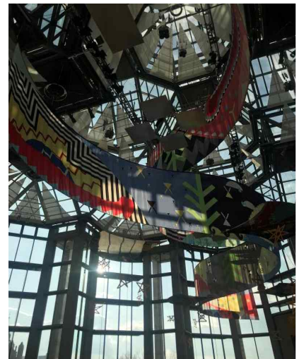
국립미술관 전시 모습→

- 현재 캐나다 국립미술관에는 국제 원주민 예술 작품 전시회 Feu Continuel이 진행되고 있음. 캐나다를 포함한 16개국의 약 40개의 원주민 및 부족에서 70여명의 예술가가 참여하였음. (2019.11.8.~2020.4.5.)