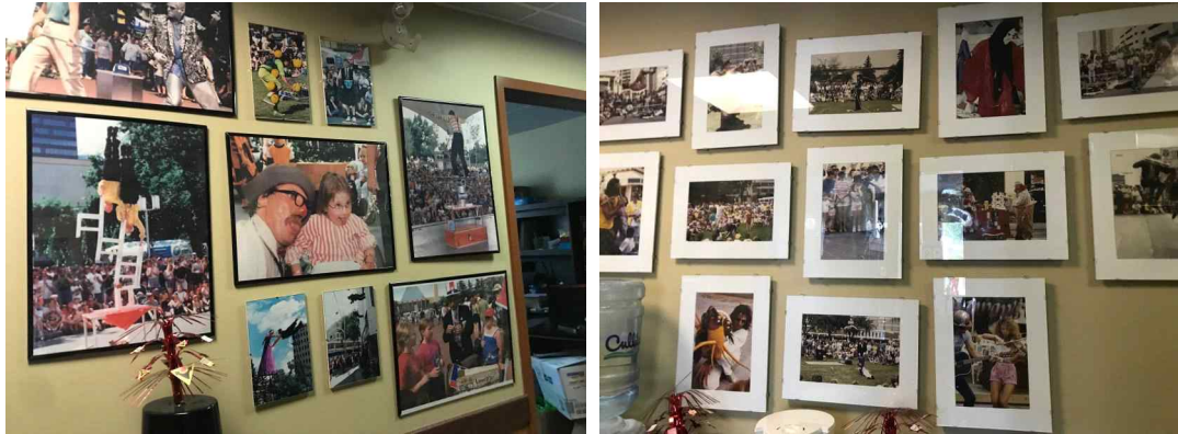
↳ 사무실 곳곳에 에든먼튼 페스티벌의 역사를 살펴 볼 수 있는 사진이 빼곡히 전시되어 있음